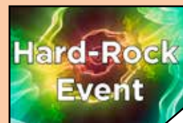
Lost In Sanity & Izzid za 30 november