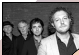
King Of The World za 21 september